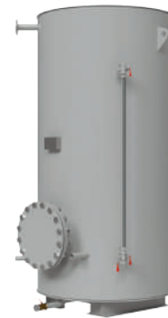
Бак сбора конденсата

При необходимости в комплект поставки могут быть включены насосный модуль для перекачки конденсата и система автоматизированного контроля качества поступающего конденсата.